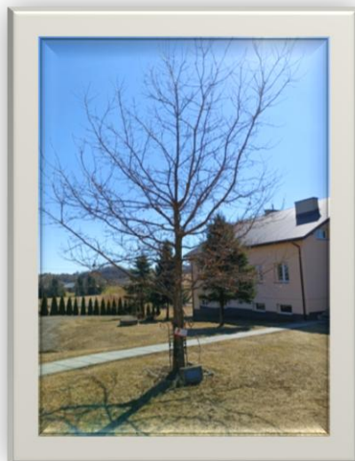
Dąb Pamięci Wojciecha Bursy – majora Wojska Polskiego - w Dudyńcach