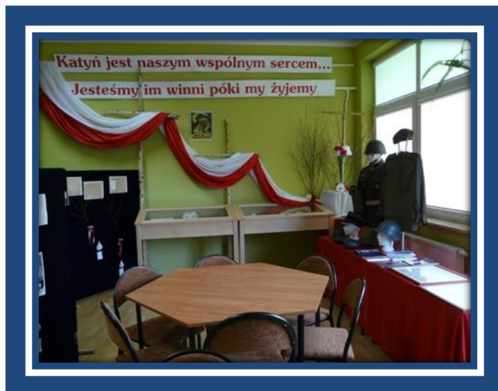
Wystawa w bibliotece szkolnej: „Katyń... ocalić od zapomnienia”

Więcej informacji o wydarzeniach z uroczystości można znaleźć w „Kronice ZS im. Jana Pawła II w Pobiednie – rok szkolny 2010/211” oraz na stronach internetowych: