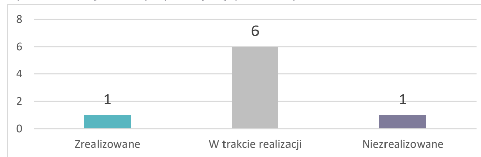
Wykres 2 Realizacja założonych przedsięwzięć podstawowych

Dotychczas zrealizowano jedno przedsięwzięcie główne, a sześć jest w trakcie realizacji. Jedno zadanie pozostaje niezrealizowane.