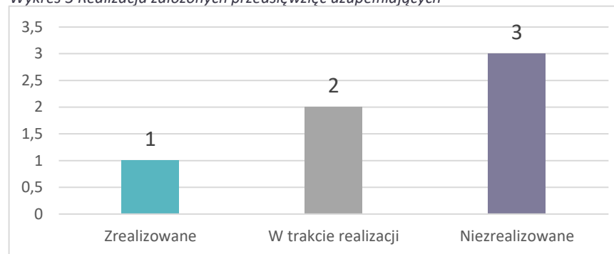
Wykres 3 Realizacja założonych przedsięwzięć uzupełniających

Z założonych przedsięwzięć uzupełniających zrealizowano jedno, w trakcie realizacji są dwa, a trzy pozostają niezrealizowane.